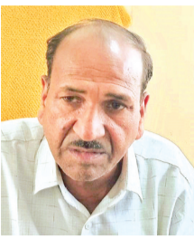
हरिभूमि न्यूज | अशोकनगर